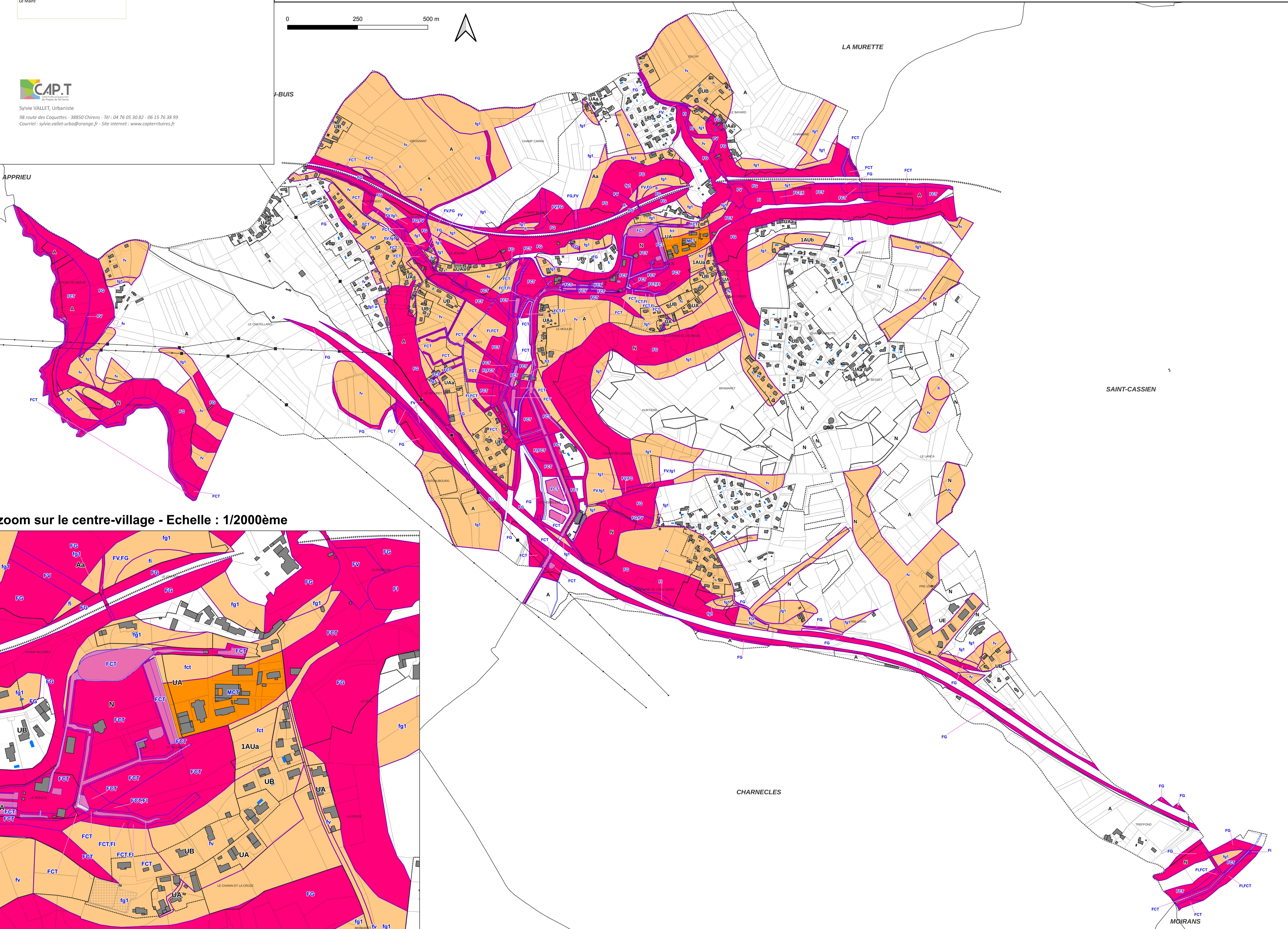
zoom sur le centre-village - Echelle : 1/2000ème